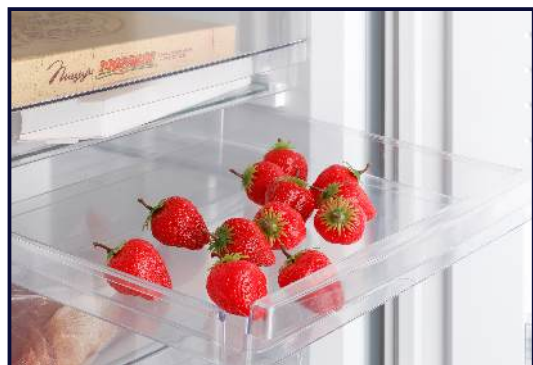
Сосуд (для замораживания ягод и др. мелких продуктов)