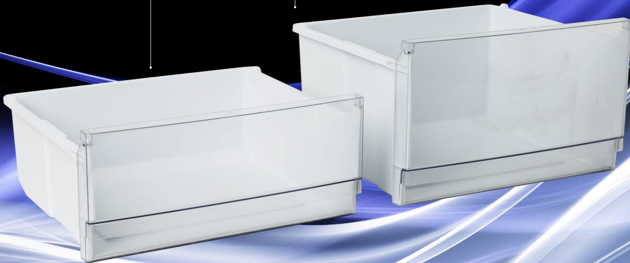
Корзина увеличенного объема BigBox

В корзину Big Box легко загрузить для замораживания или хранения тушку индейки или крупный кусок мяса.