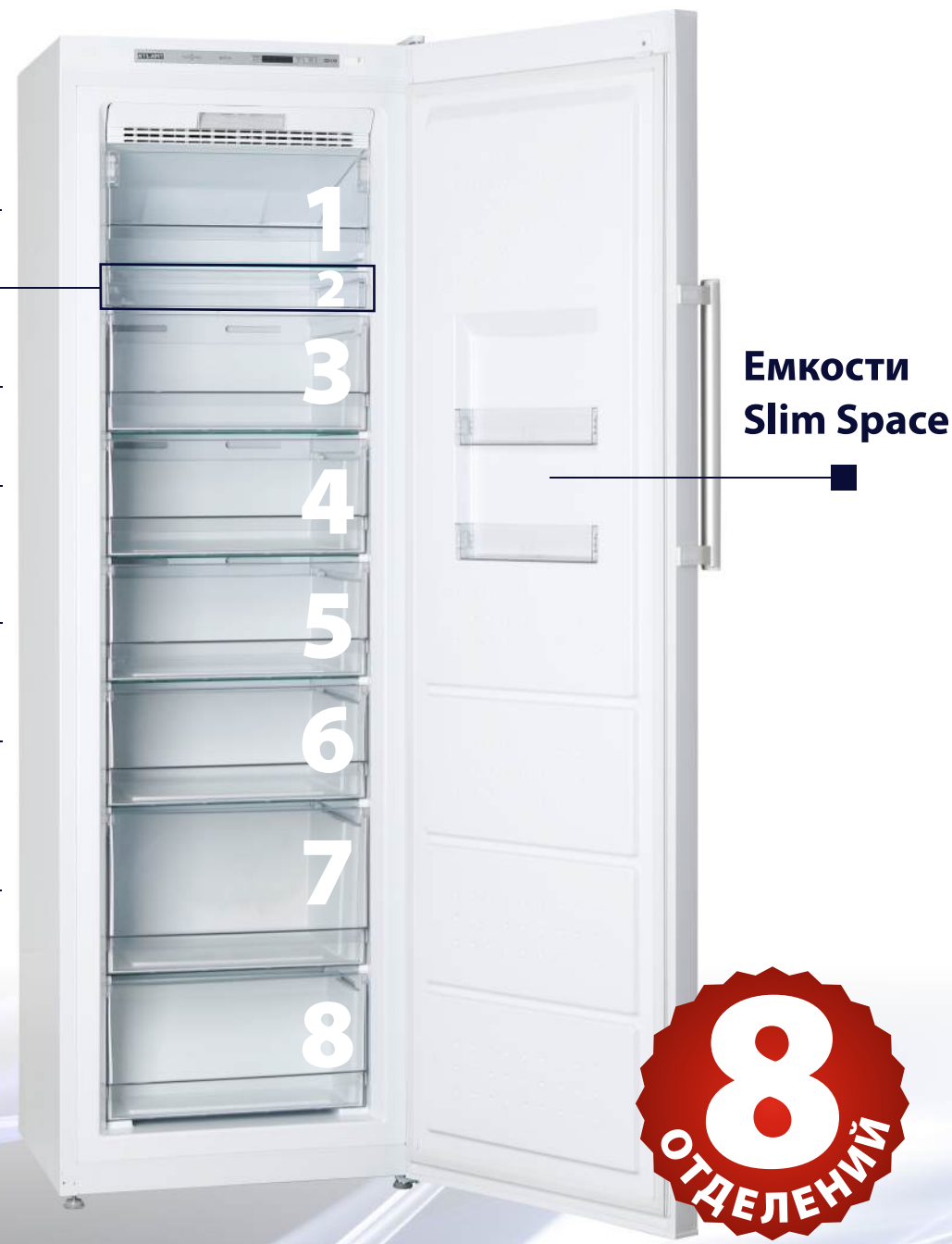
Емкости Slim Space