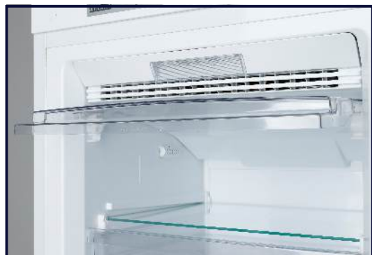
Отделение с откидной панелью